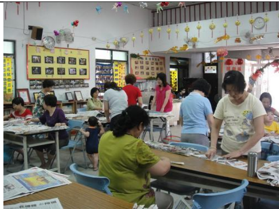
里民製作再生物品